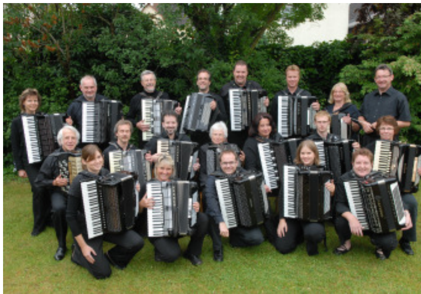
1. Orchester der AVP

Die Liebe zur Musik bestimmt seit der Gründung im Jahre 1936 bis zum heutigen Tag nachhaltig die Vereins-, Orchester- und Jugendarbeit der Akkordeon-Vereinigung 1936 Pfungstadt e.V.. Ein wichtiges Ziel des Vereins ist die Pflege der Akkordeonmusik im weitesten Sinn.